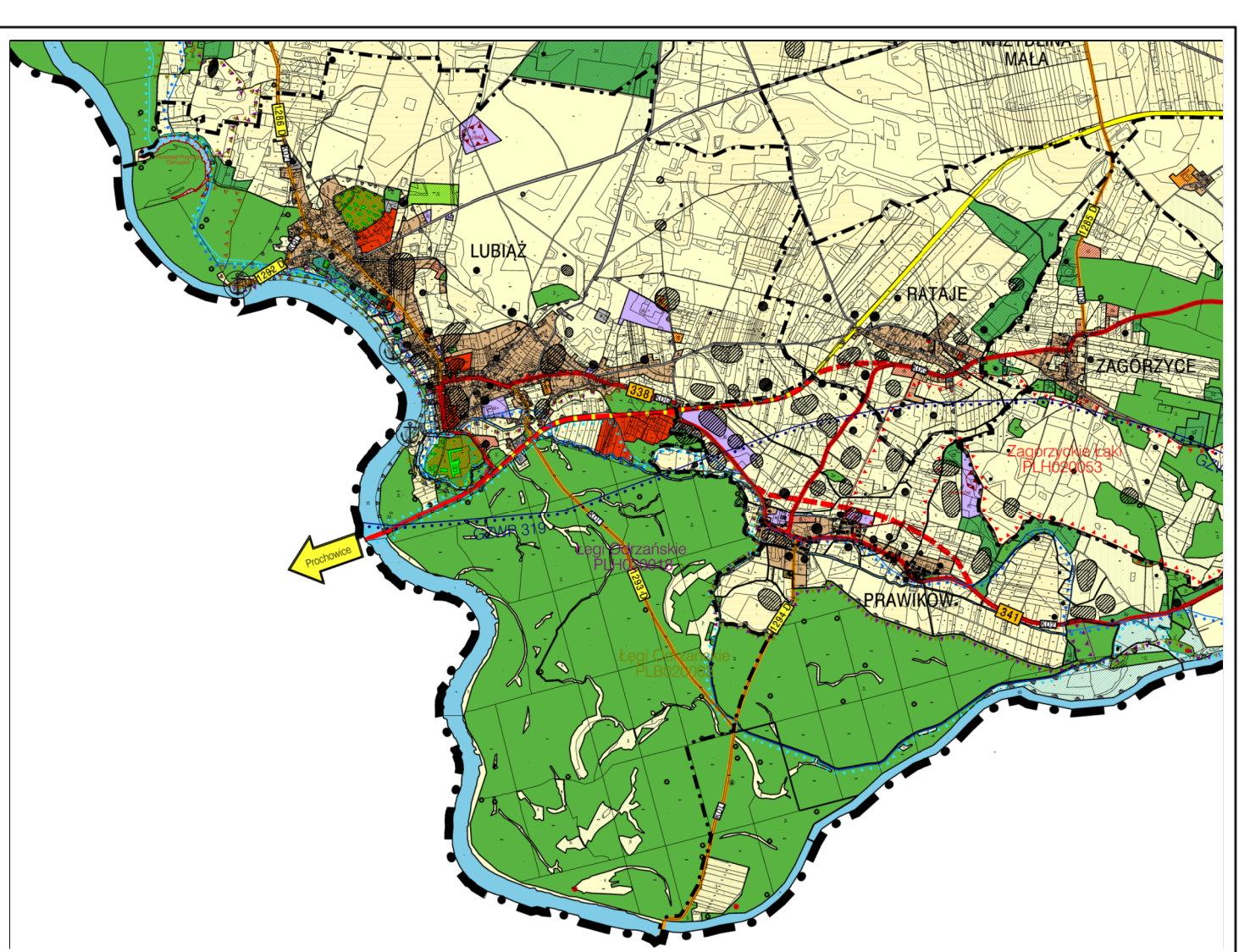
Wyrzys ze SUIKZP miasta i gminy Wołów